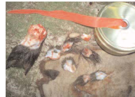
Tendon – Venaison – Soie – Peau