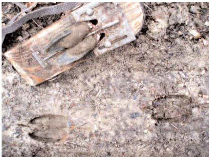
« Beau revoir » avec les semelles